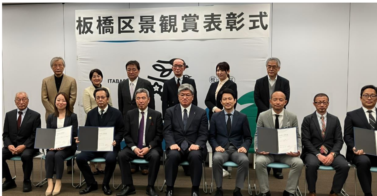
▲3月27日 板橋区景観賞表彰式の様子

今後も、人と文化のつながりを踏まえた上で、環境に着目した社会にも貢献できるまちづくりを目指していきます。